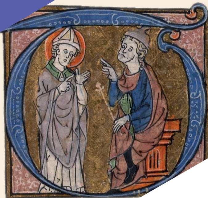
Saint Cyprien de Carthage et le proconsul, missel de l'abbaye de Montier-la-Celle (Champagne), fin XIII e – début XIV e siècle Paris, Bibliothèque nationale de France, nouvelles acquisitions latines 3241, fol. 131 r o